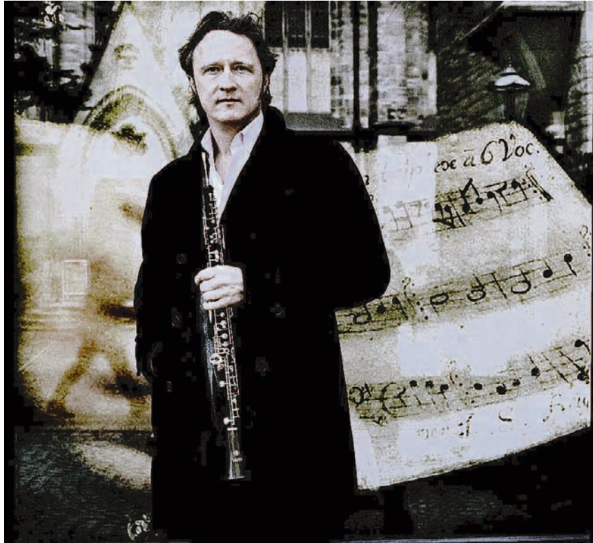
Oboist Albrecht Mayer ist weltweit als Solist tätig.

Im Oltner Auftritt gehts klassischer zu und her: Zu Beginn erklingt das Vorspiel zur Oper «Capriccio» von Richard Strauss, ein dichtes, klangseliges Sextett für Streicher. Albrecht